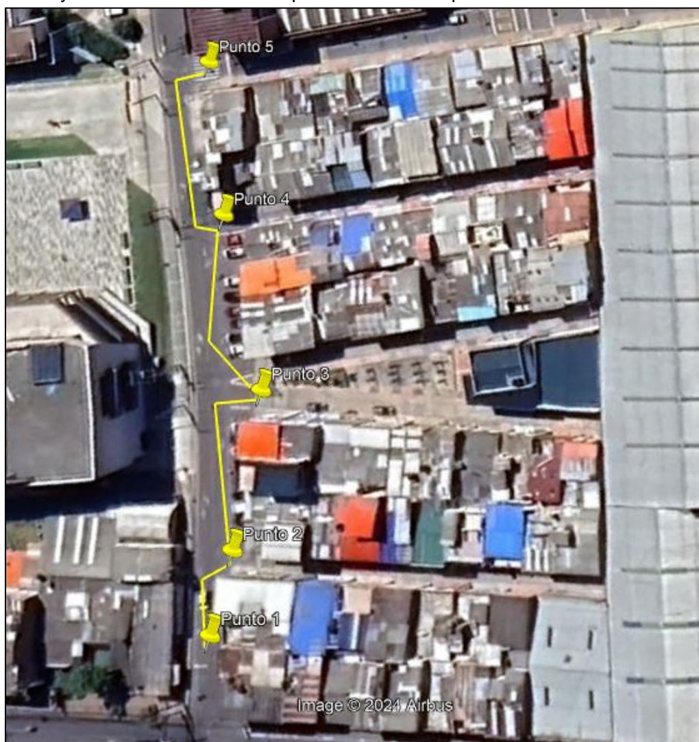
Ilustración 1. Recorrido verificación ambiental

Se realizó recorrido de control y vigilancia en el cuadrante 4, barrio VILLA ADRIANA el día 07 de agosto del 2024, desde las coordenadas 4°43'0,84"N- 74°12'24,294"W hasta las coordenadas 4°42'57,816"N- 74°12'22,758"W (ver ilustración 1. Ruta amarilla), con el fin de verificar las condiciones ambientales, identificar posibles afectaciones a los recursos naturales y realizar las acciones de prevención correspondientes.